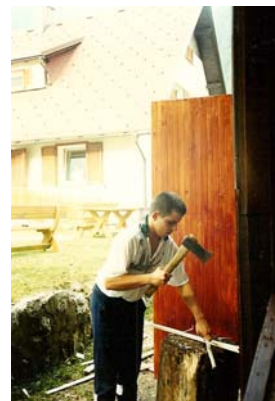
Priprava trsk za podkurit