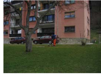
Vzdrževanje mestnih zelenic

Delo na kmetiji mi je všeč in odkar hodim gor, sem se marsikaj novega naučil.«