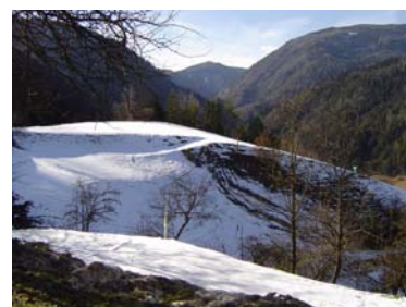
Gozdovi in travniški sadovnjaki okoli Črne in nad njo