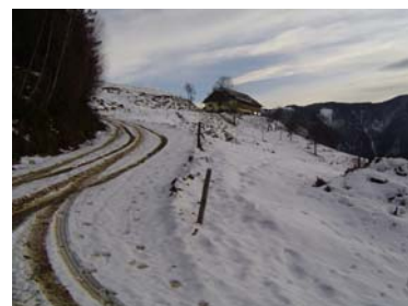
Hribovsko kmetijstvo okoli Črne in nad njo

V bližnji in daljni okolici naše ustanove je kar veliko manjših in večjih kmetij. Naši učitelji in vzgojitelji so pri učenju kot eno od specialno pedagoških metod uporabljali metodo praktičnega pouka oz. izkustvenega učenja v naravnem okolju, kmetje pa so zlasti v času spomladanskih in jesenskih opravil na kmetijah potrebovali dodatno delovno moč; in tako smo eno z drugim združili, zadovoljstvo pa je bilo vedno obojestransko.