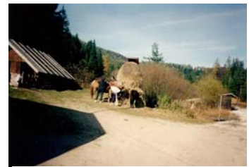
Priprava senene kopice

»Vlada naj se potrudí, da omogočí, da bi hodili na kmetijo.«