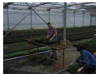
Presajanje sadik v vrtnariji

»Gnoj vozim, pa stelo režemo ; je fajn ostati s kmetovo družino.«